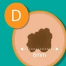
Diametru 6 > \text{mm}