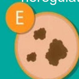
Evoluție (o aluniță care arată diferit de restul sau își schimbă mărimea, forma, culoarea)

Autoexaminarea pentru depistarea cancerului de piele