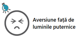
Aversiune față de luminile puternice